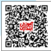
نمونه املاي حافظه